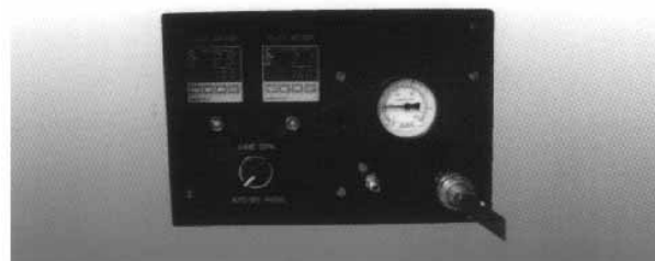
CAIXA DE CONTROLE